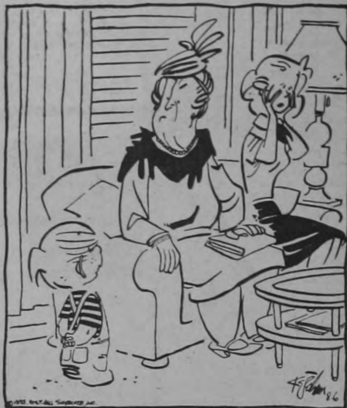
—Mamá me había dicho que usted tenía dos caras.