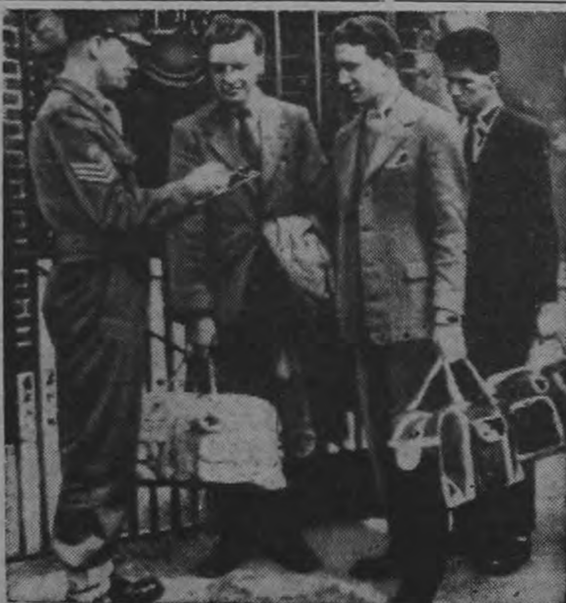
Un sargento toma nota de los guardias que vestidos de civiles han sido llamados de sus licencias por la crisis de Suez en Inglaterra donde se ha ordenado a 250.000 reservistas del ejército volver al servicio, para ser despachados en aviones de bombardeo a Malta, y se dieron órdenes a todas las unidades de la escuadra en el Mediterráneo de estar alerta. La foto se tomó en el cuartel de Windsor, en Londres.