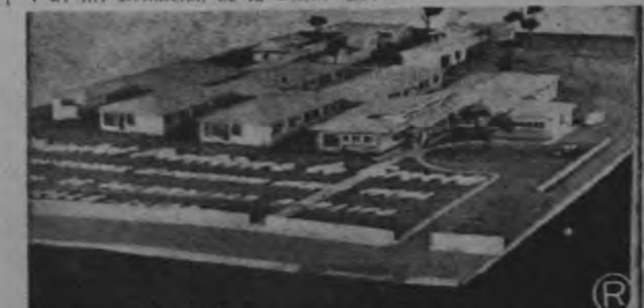
HOSPITAL PERIFERICO DE GRECIA.—Esta es la fotografía de la maqueta del Hospital Periférico de Grecia, que ya ha sido construido y que se inaugurará el próximo 12 de agosto de este año. Obsérvese lo imponente de la obra, que ha sido posible gracias a la colaboración del Ministerio de Obras Públicas y de Salubridad Pública y de la Junta de Protección Social de Grecia.

Consejo Técnico de Asistencia Médico Social ₡ 843.180.00 (renta de la Lotería Nacional) Ministerio de Obras Públicas, ... ₡ 637.000.00 Junta de Protección Social de Grecia ₡ 350.000.00. Costo total: ₡ 1.830.180.00