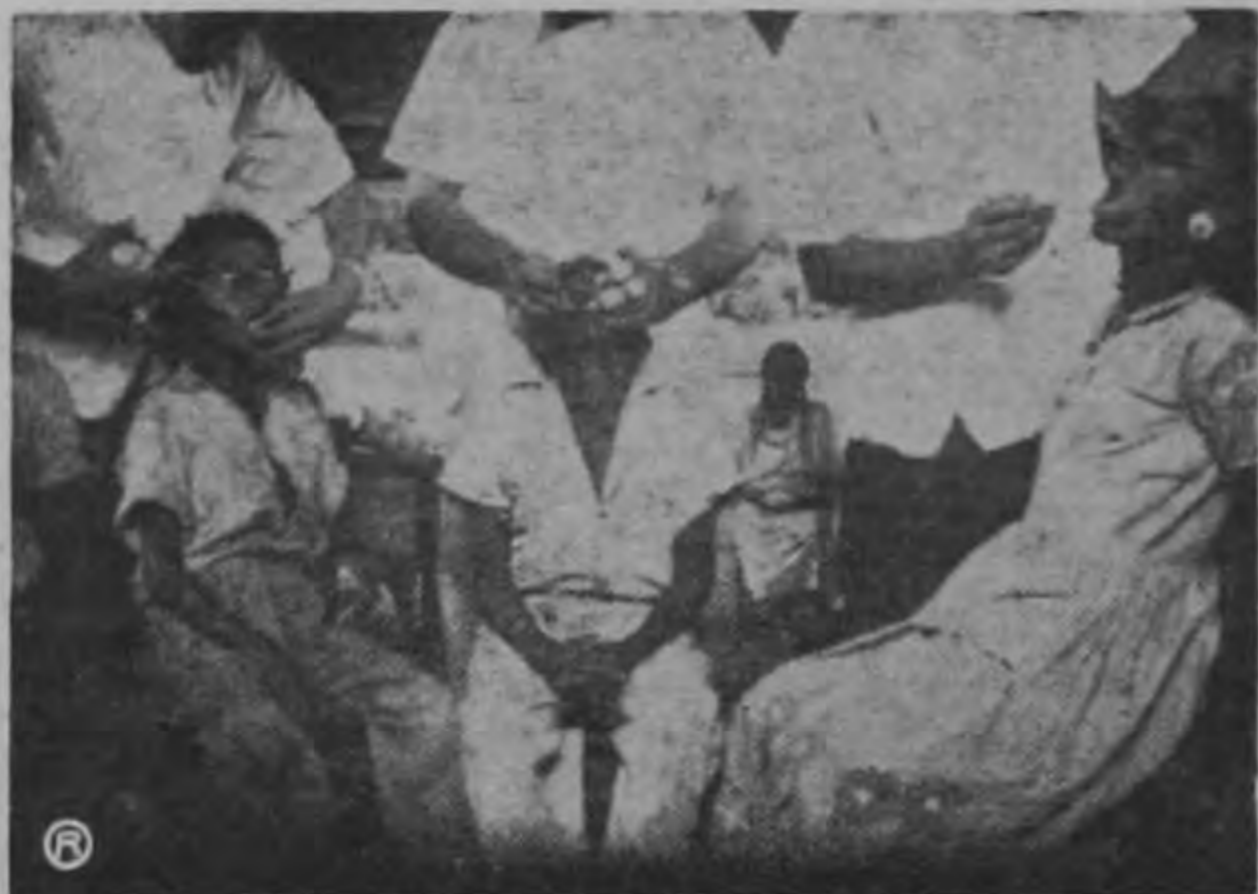
UNIVERSITARIOS EN ACTIVIDAD.—El grupo de estudiantes de la Escuela de Odontología que fue a nuestras regiones indígenas, aparece en esta foto prestando servicios gratuitos a los habitantes de ese sector del país.

Al despedirse de nuestra oficina de redacción, queda en el ambiente el eco de esta frase: Los estudiantes y profesores de las otras facultades, no saben lo que se pierden, si no hacen una gira como la hemos hecho nosotros.